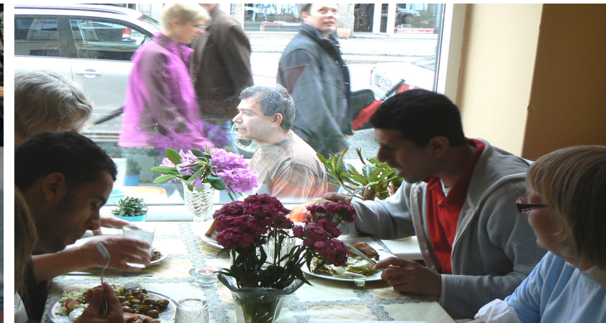
"Maden smager bedst, når man spiser i fællesskab." Gæst hos Muhabet