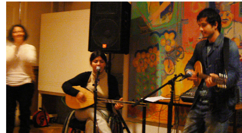
"Når maven er mæt, så synger hovedet." Gæst hos Muhabet

Hos Muhabet fejrer vi hvert år ramadanen. Vi tager også ud til indlagte med muslimsk baggrund på de lukkede afdelinger med en ramadanpakke med lidt lækkerier fra Muhabet .